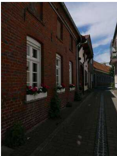
Gasthausstraße mit Ackerbürgerhaus