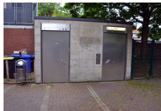
Öffentliches WC am Marktplatz