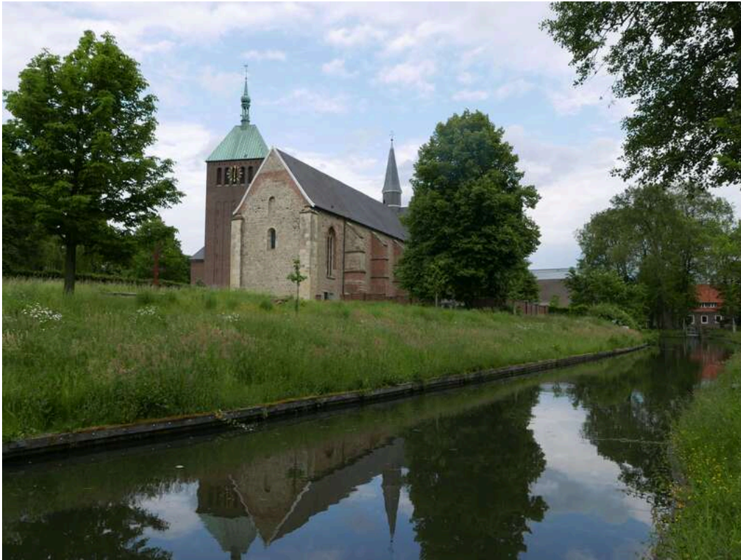
Stadtrundgang Vreden für Alle