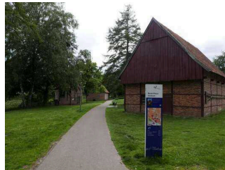
Stadtpark mit Hofanlage