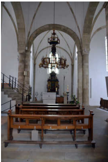
St Felizitas Kirche