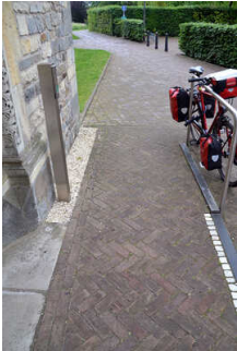
St Felizitas Kirche