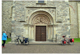
St Felizitas Kirche