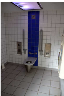
Öffentliches WC am Marktplatz