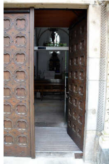
St Felizitas Kirche