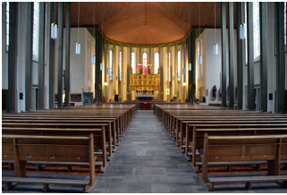
St Georg Kirche