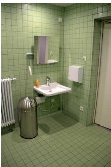
Öffentliches WC kult