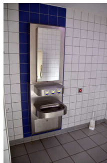
Öffentliches WC am Marktplatz