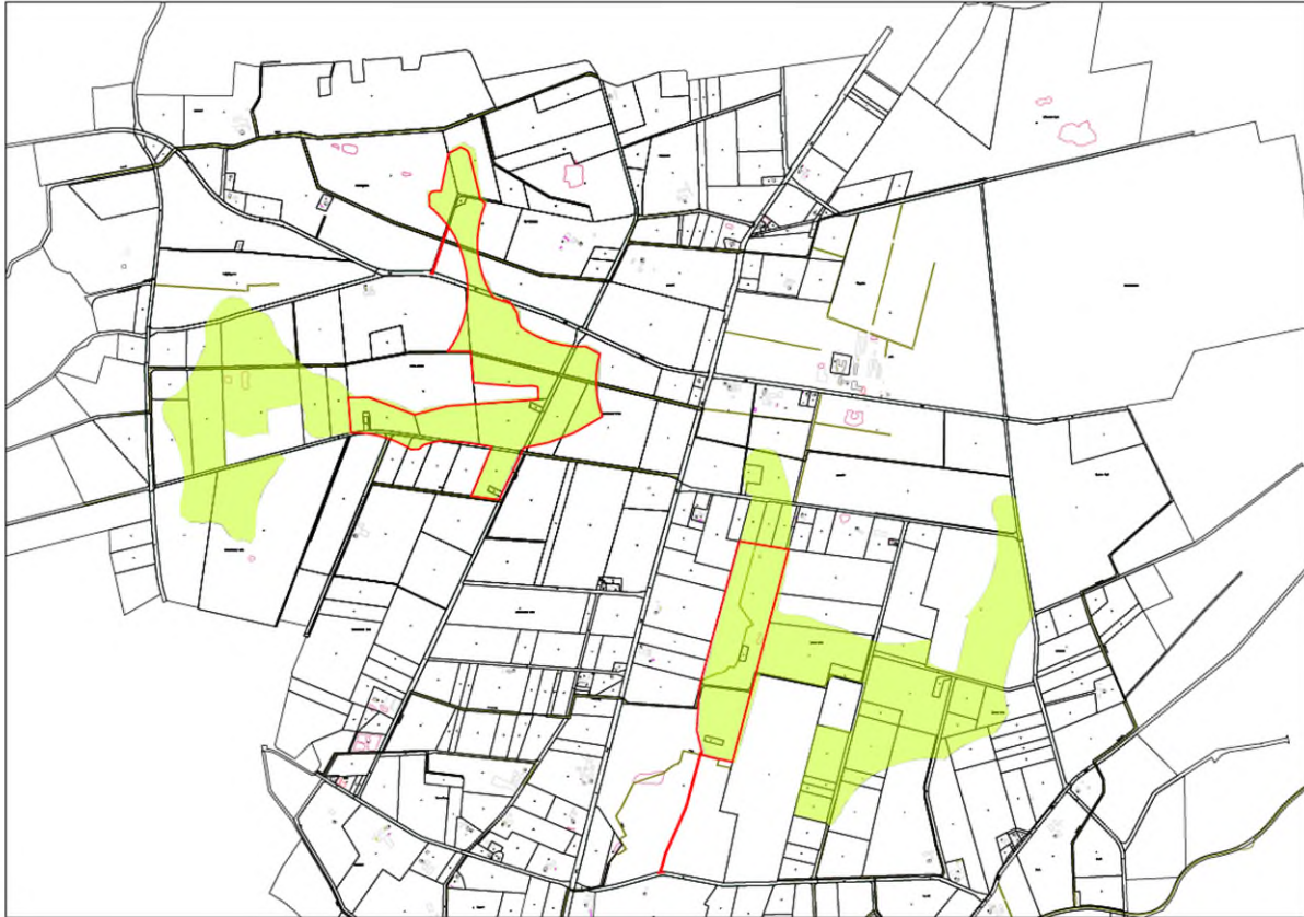
Geltungsbereich Vorhabenbezogener Bebauungsplan Nr. 61, Stadt Vreden

Der Geltungsbereich der Teilaufhebung umfasst ganz oder teilweise folgende Flurstücke in der Gemarkung Vreden: