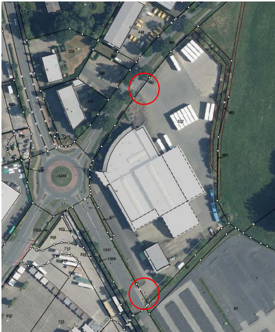
(Luftbild 2018 mit bestehenden Zu- und Abfahrten, ohne Maßstab)

Die Vergangenheit hat gezeigt, dass die vorhandene Zu- und Abfahrtsituation für die verkehrliche Abwicklung im Plangebiet ausreicht.