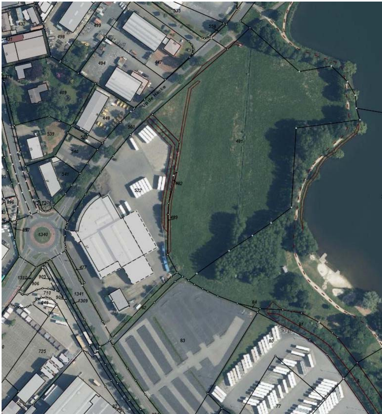
(Luftbild 2018, ohne Maßstab)